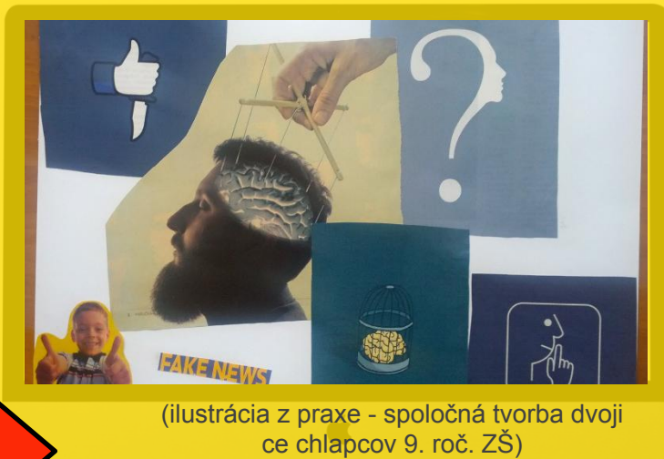
(ilustrácia z praxe - spoločná tvorba dvojice chlapcov 9. roč. ZŠ)